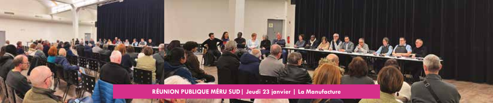
RÉUNION PUBLIQUE MÉRU SUD | Jeudi 23 janvier | La Manufacture