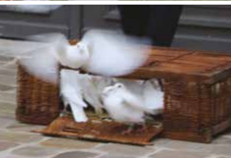
Des lâchers de pigeons ont lieu régulièrement lors des cérémonies commémoratives, au forum des associations...

participent à différents concours qu'ils soient locaux, régionaux, nationaux voire internationaux, et sur différentes distances : vitesse, fond, demi-fond... Capables de voler jusqu'à 1000 km sans s'arrêter, et jusqu'à 100km/h en fonction des vents, ces pigeons regagnent toujours leur colombier, grâce à leur sens inné de l'orientation, quel que soit l'endroit duquel ils sont lâchés, même depuis Barcelone par exemple.