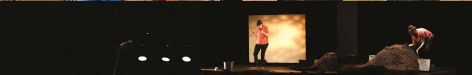
LA TROUÉE, ROAD-TRIP RURAL | Mardi 4 février | Théâtre du Thelle