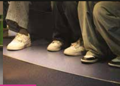
LA NUIT DE LA LECTURE | Samedi 25 janvier | Médiathèque Jacques Brel