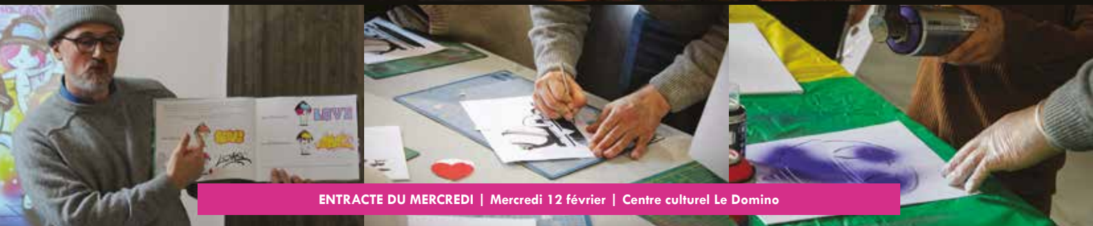
ENTRACTE DU MERCREDI | Mercredi 12 février | Centre culturel Le Domino