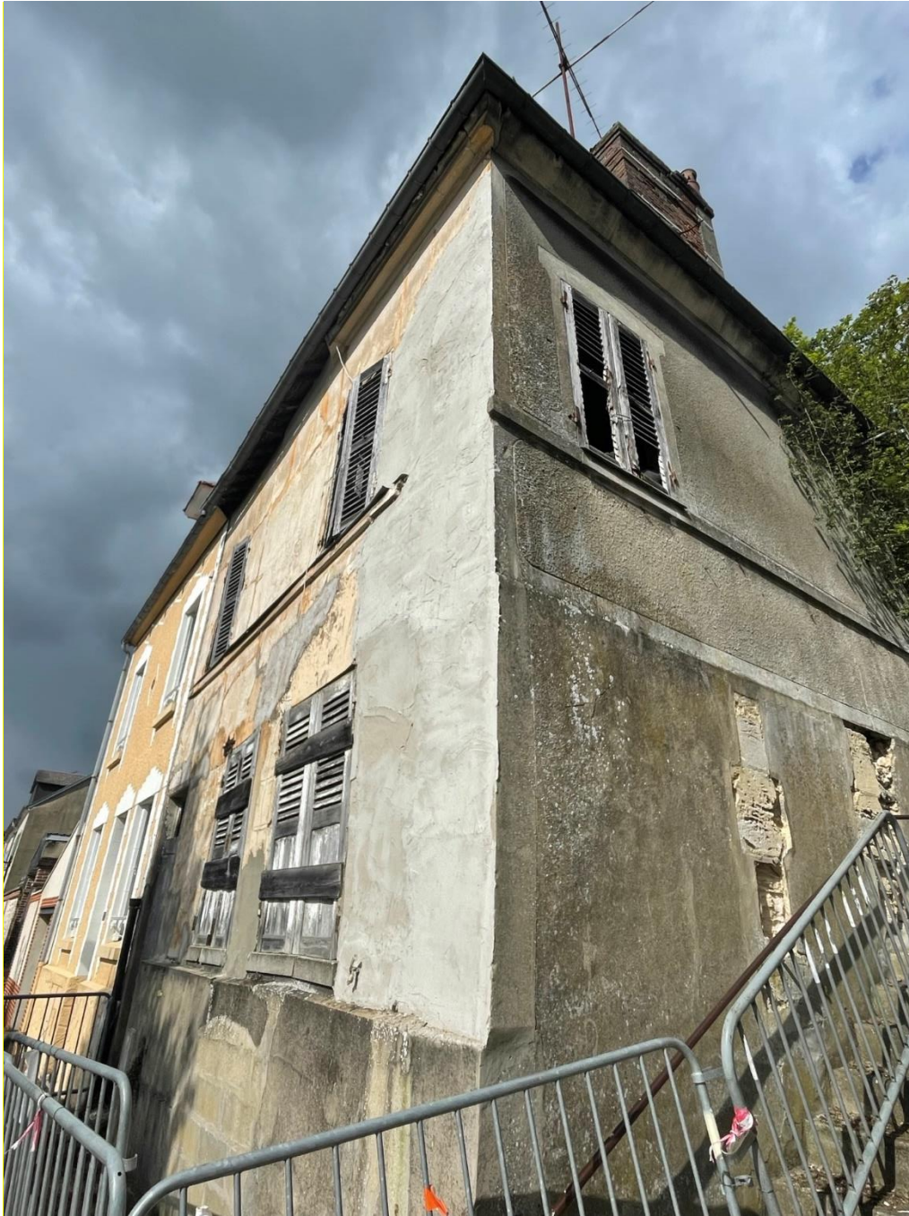
Après travaux urgents réalisés par la commune