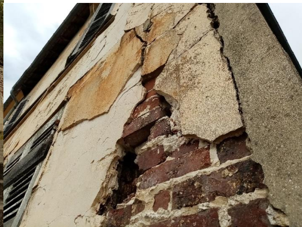
Avant travaux urgents réalisés par la commune