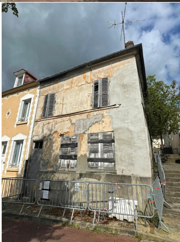
Commune de Méru Parcelle en état d'abandon manifeste 14 place du Jeu de Paume Projet simplifié d'acquisition publique